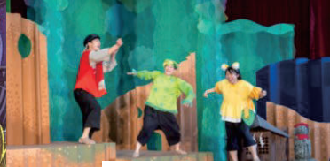
テング カッパ キツネ