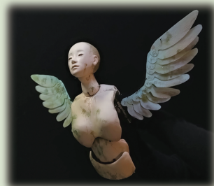
ハネトテ 〈Wings and Hand〉

この宇宙のどこか彼方の惑星で こんな者や あんな物の いるんじゃないと なみや現象が あるのかもしれない (さびしかったり、たのしかったり... ただ動いていたり) それとも この地球で、はるか昔にあったこと? いつか未来に起きること? カタチが動いて、音楽が流れると そんな気がします。