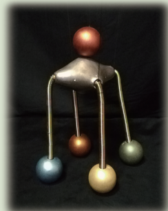
タマアタマ 〈Ball Head〉