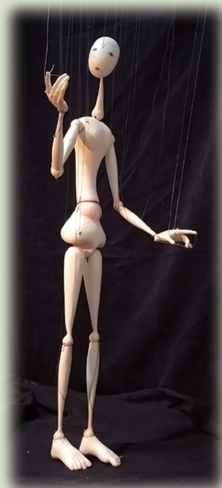
ホソイノ 〈The Thin One〉